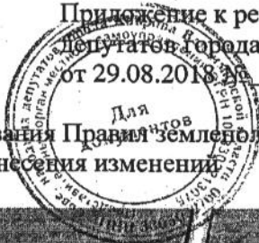
Фрагмент карты градостроительного зонирования и Правил землепользования и застройки города Ковров до внесения изменений