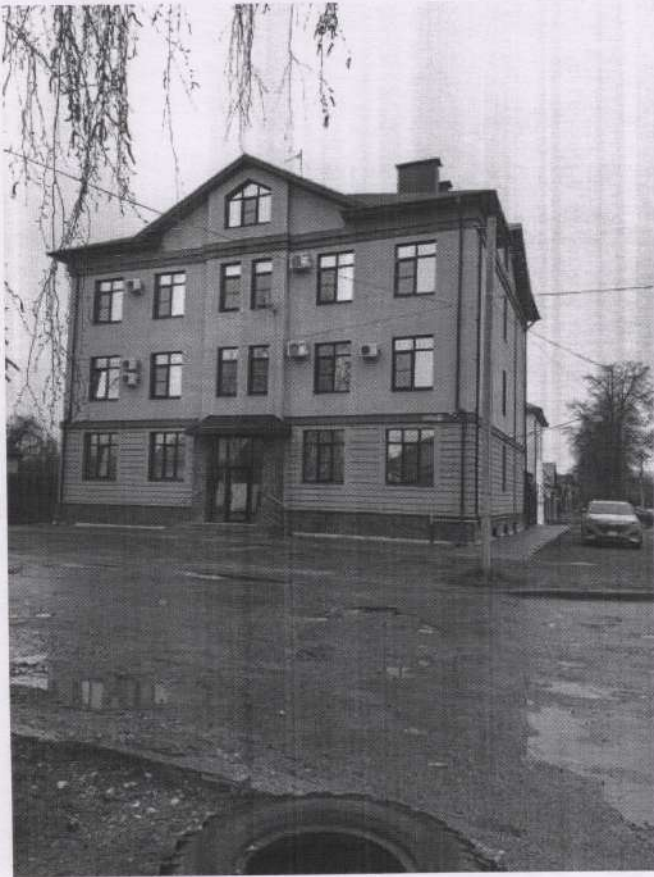
г. Ковров ул. Челюскинцев, д.154