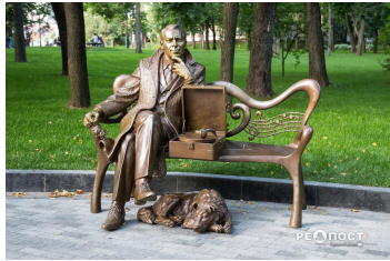
Скульптура Мужчина с патефоном