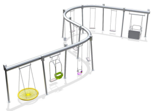
Качели (3 подвеса)